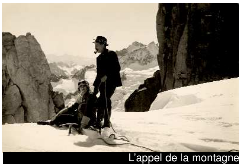
L'appel de la montagne